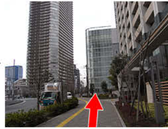
③そのまま真っすぐ進みます。