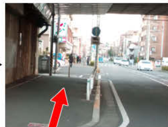
⑩高架の先にセブンイレブンが見えてきます。