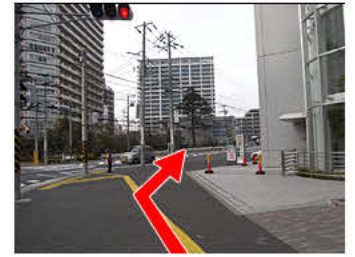
④右手にリッチモンドホテルがあります。そのまま道沿いに進みます。