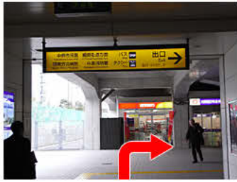
①JR「武蔵小杉」駅 新南改札(横須賀線口)を出て、右に曲がります。