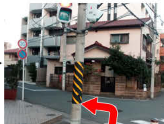
⑪セブンイレブンの前を通過して、美容室の角を左折します。(信号は渡りません)