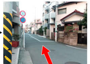
⑫真っすぐ進みます。