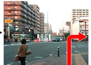
⑧下ったところで左手にデニーズ、正面に小学校が見えます。その信号を渡って、小学校に沿って右折します。