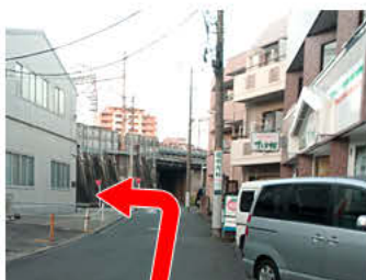
⑬右手にシャディのサラダ館、正面に電車の高架が見えます。高架の手前、左手にお店があります。