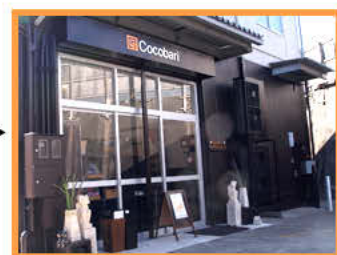
ココバリの店舗に到着!