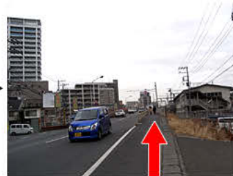
⑥ずっと真っすぐ進みます。