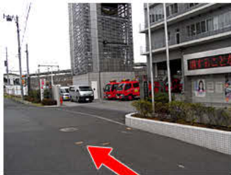
⑤すぐ右手に消防署があります。真っすぐ進んでください。