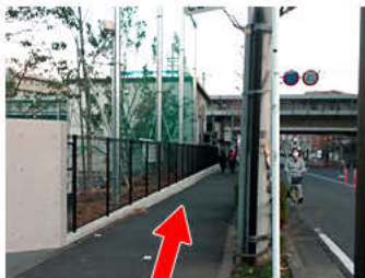
⑨小学校に沿って、真っすぐ進みます。