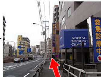
⑦動物医療センターが見えてきます。陸橋を渡り切ります。